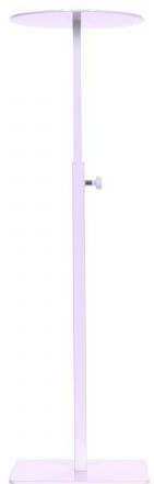
BTF793 –viš 30-50 cm, bela 26,00 €