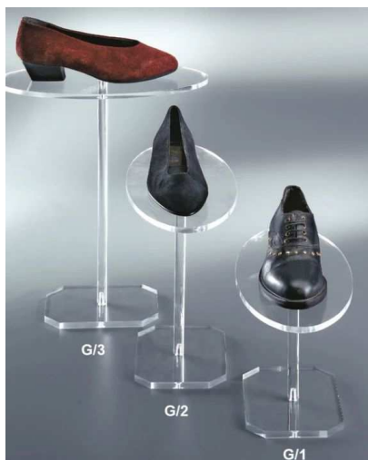
EVG -viš 15,26 ali 28cm akril 30 € | 34 € | 40 €