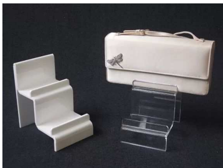
EV1615S - 10x15 cm, bela, črna ali transp 20,00 €