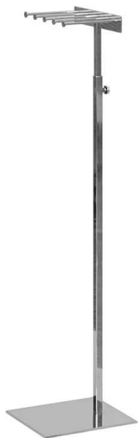
FI050 -viš 125-180cm krom 90,00 €