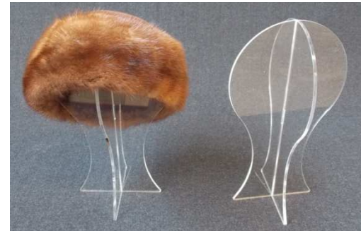
BVEPCA100 –18x30cm. Akril v beli, rni ali prozorni 18,00 €