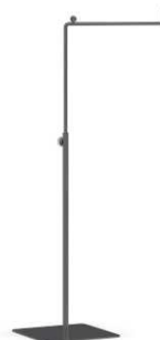
FI019 –35-65cm, črna 18,00 €