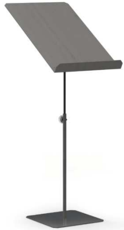
FI219 –viš 35-66 cm, bela ali črna 28,00 €