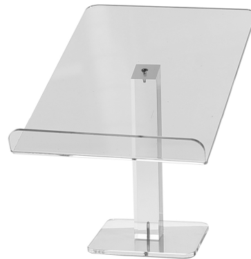
EV6011 –viš 28 cm, akril 36,00 €