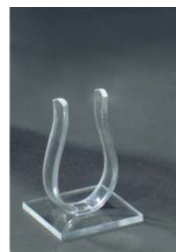
EV123 -viš 10 cm, akril 6,00 €