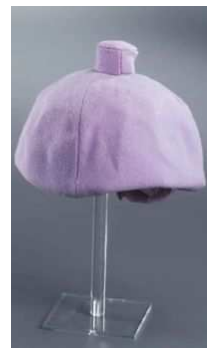
BEVPC –viš 20,30,40 ali 50 cm, akril 140 € | 16 € | 18 € | 20€