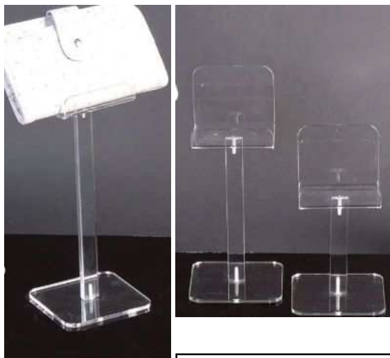
EV1616PD - viš 14,20,26 ali 32 cm, akril 10,00 - 14,00 €