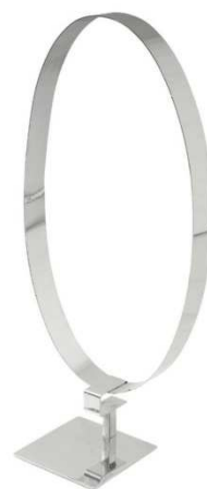
AST0032 -50x24cm, inox 36,00 €