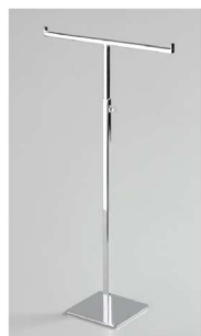
PL7001 –48-85cm, krom, črna, bela 20,00 €