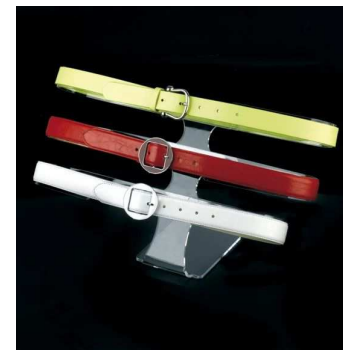
EV14103 - 30cm, akril 49,00 €