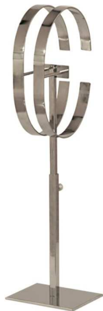
viš cm inoxl 00,00 €