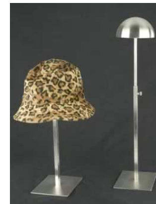
BEVPCQ –viš 30-60 cm, mat krom 32,00 €