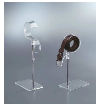
BEVRE6 - 15-30cm, akril