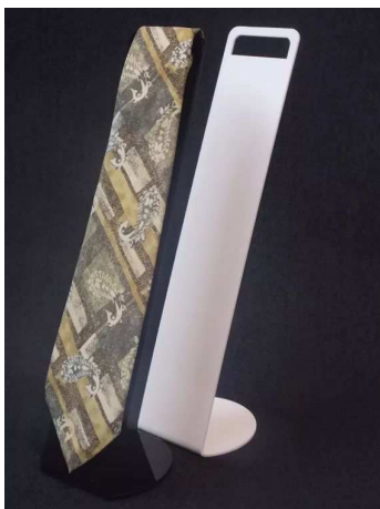
EVPCR50 –viš 50 cm, akril 13,00 €