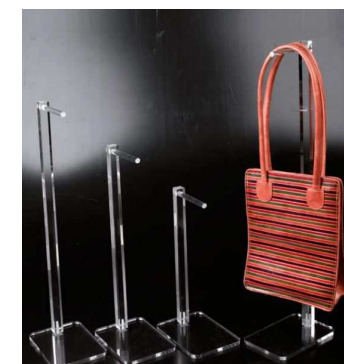
BEVPB_3060, akril, višine od 30 do 60 cm Od 17,00 - 27,00 €