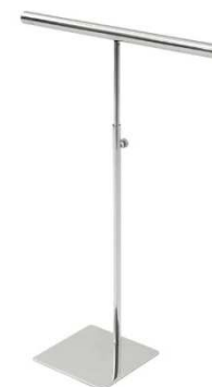
AST0035 –37-62cm, inox 21,00 €