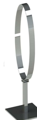
BES08 -viš 50 cm, bela ali krom 35,00 €