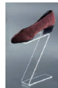
EVZ1 -viš 10,15 ali 20 cm, akril 12,00 €