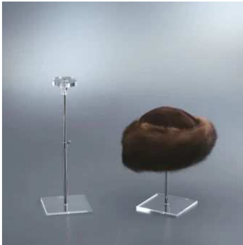
BEVRE8 –viš 15-30cm akril 15,00 €