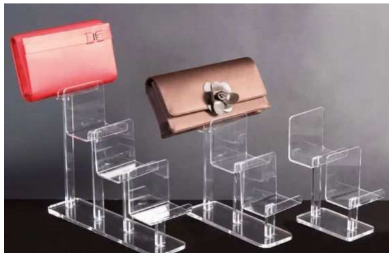
EV1615P - akril 22,00 - 34,00 €