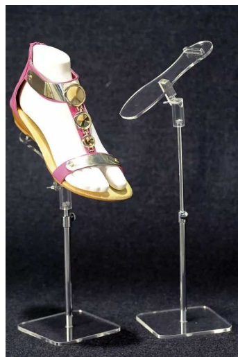
EV199N -vel 38, Črna ali bela 17,50 €