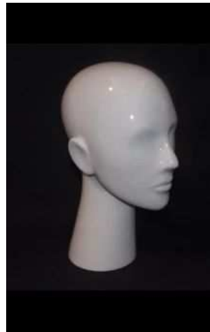
BEV708–viš 30 cm. Črna ali bela sijaj 36,00 €