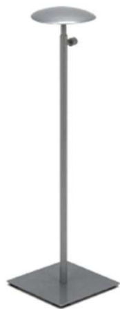
BMP202 –viš 50-90cm alu siva 32,00 €