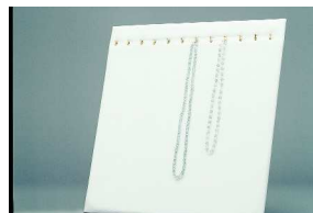
Stojalo za obešanje ogrlic 30x39cm, bela ali črna