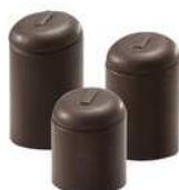
Nastavki za prstane, 3 delni 8,5 -7,7-6,2 cm, črn ali bel