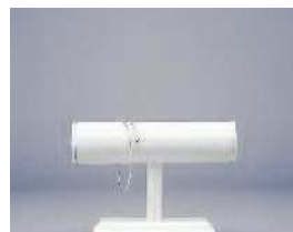
Stojalo za zapestnice 13x19, premer 4cm