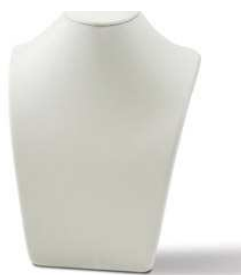
Ovratnik za ogrlice 33 cm ali 27cm ali 21 cm ali 18 cm