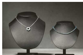
Ovratnik za nakit Višina 22 cm, bela ali črna