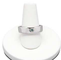
Nastavek za prstan 4cm, bel ali črn