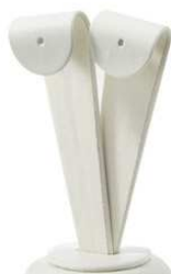
Nastavek za uhane, double Višina 9 cm, bela ali črna