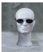
Izložbena glava—moška Iz stiropora, bela