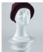
Izložbena glava—ženska Iz stiropora, bela