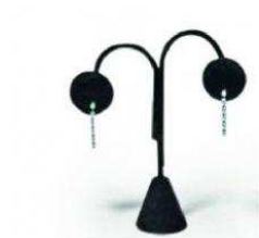
Nastavek za uhane 12 cm, črn