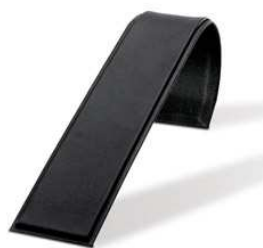
Nastavek za uro 6x4x18cm , 6x4x22 cm, bela ali črna