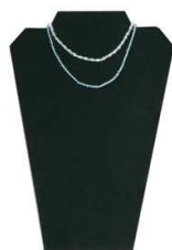
Stojalo za ogrlice 22x32 cm, bela ali črna