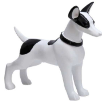
Bolt – 42cm, črna ali bela