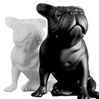
Buldog – 40 cm (sedeči, stoječi), črna ali bela