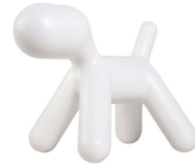
Eason – 46cm, bela