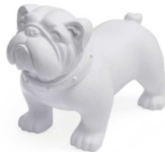
Taz – 33cm, črna ali bela