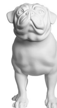
Buldog puppy – 28cm, črna ali bela