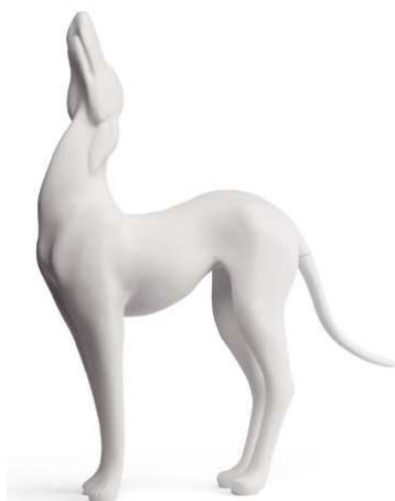
Hrt – 123cm, črna ali bela