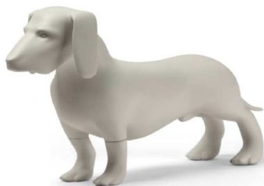
Jazbečar – 30cm, črna ali bela