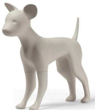
Čivava – 35cm, črna ali bela