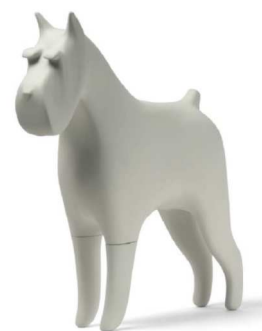
Šnauzer – 52cm, črna ali bela