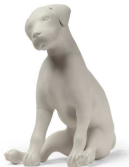
Max – 28cm, črna ali bela