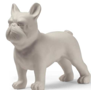
Buldog – 37cm, črna ali bela