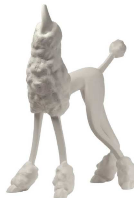
Pudelj – 100cm, črna ali bela